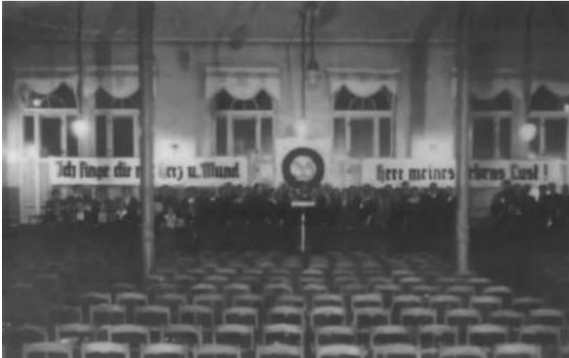
Großer Saal 1938