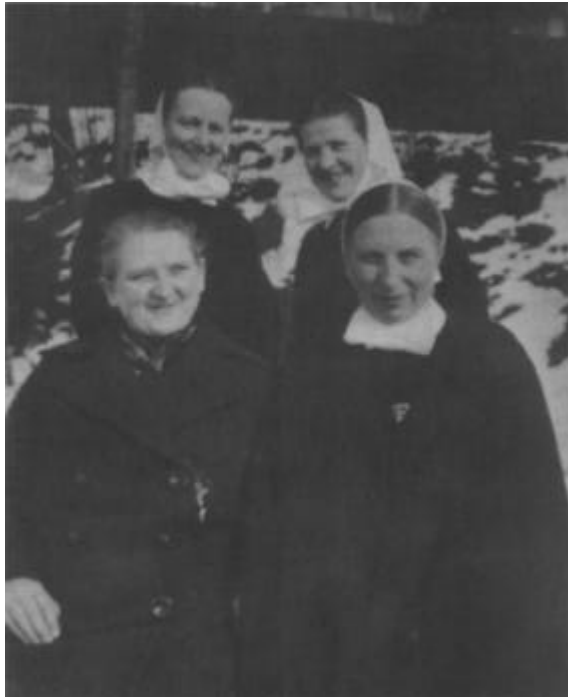
Schwestern aus der Reichenbacher Gemeinschaftsarbeit