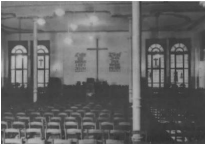
Nach der Renovierung 1949